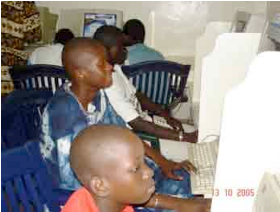
Young boys and girls at IT school